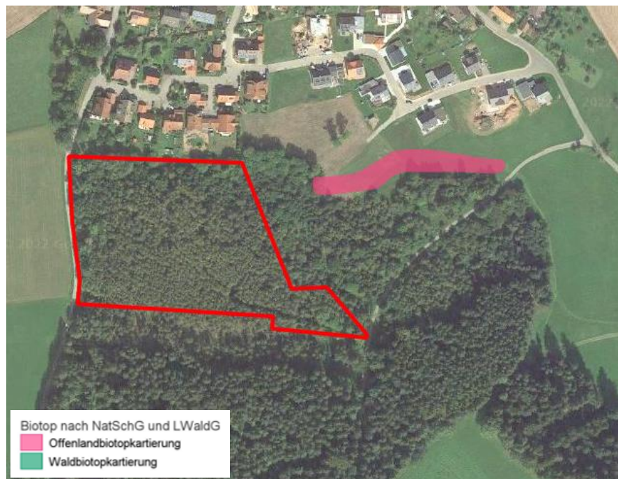
Abgrenzung des Gebiets mit Darstellung sen- sibler Bereiche: Offenlandbiotop (außerhalb)