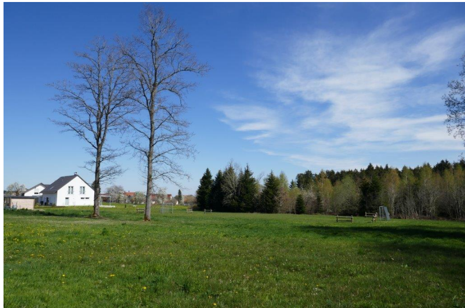
Blick von Norden auf die Planungsfläche