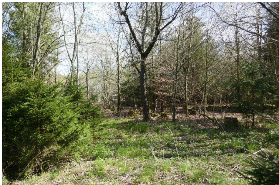
Blick in den Wald an der nördlichen Gebietsgrenze